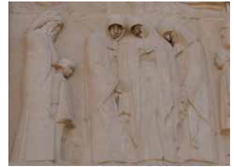
Détail du monument aux morts Gustave Violet